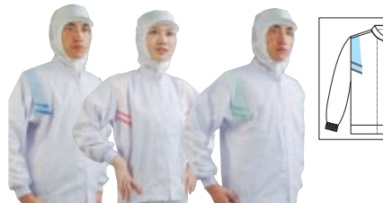
Parts No.313 Parts No.318 Parts No.327