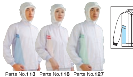
Parts No.113 Parts No.118 Parts No.127