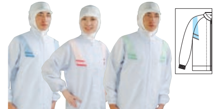
Parts No.313 Parts No.318 Parts No.327