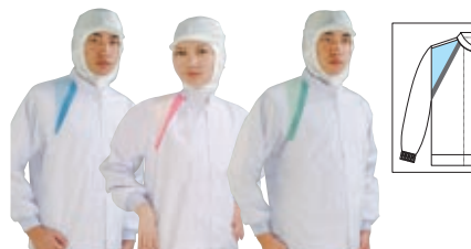
Parts No.413 Parts No.418 Parts No.427