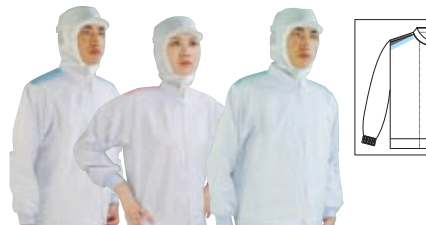
Parts No.713 Parts No.718 Parts No.727