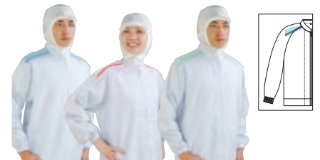
Parts No.613 Parts No.618 Parts No.627