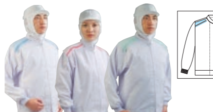
Parts No.613 Parts No.618 Parts No.627