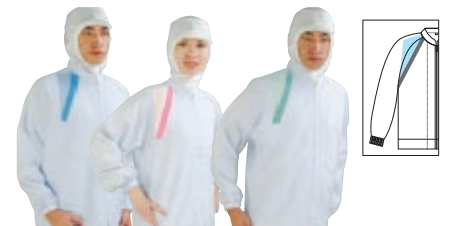
Parts No.413 Parts No.418 Parts No.427