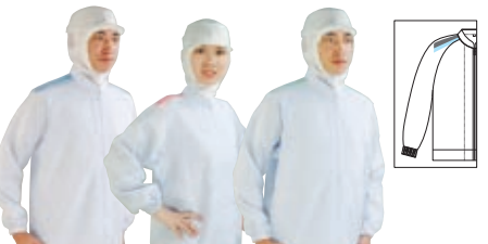
Parts No.713 Parts No.718 Parts No.727